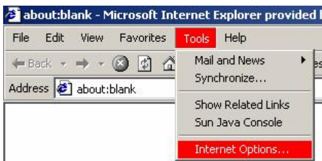
Internet Explorer 6