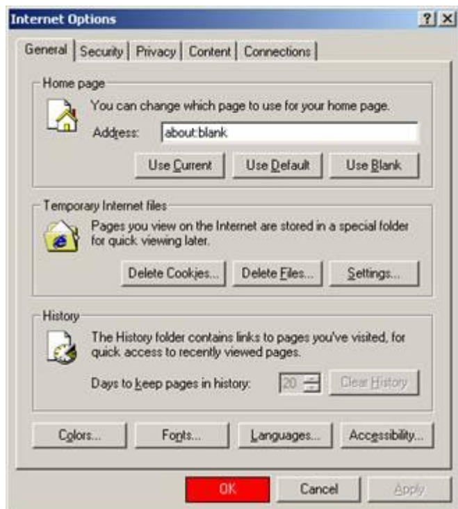
Internet Explorer 6